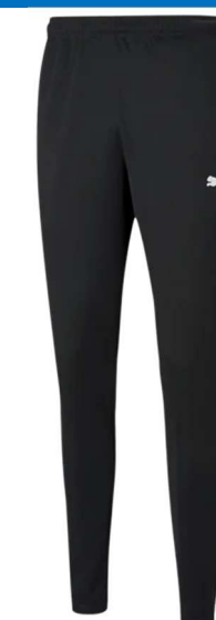
Trainingshose Schwarz 657390 - Puma Black Seitentaschen, 100 % Polyester