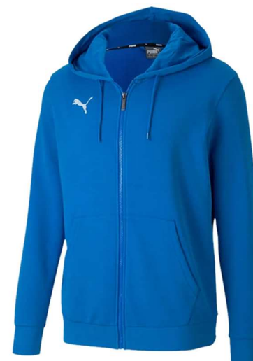
Casuals Kapuzenjacke Blau 656708 - Ele. Blue Lemonade Futter: 100% Baumwolle. Material: 68% Baumwolle, 32% Polyester