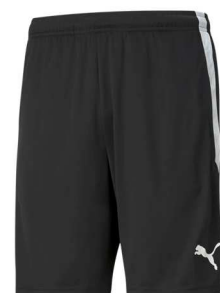
Short Schwarz 704924 - Puma Black 100% Polyester