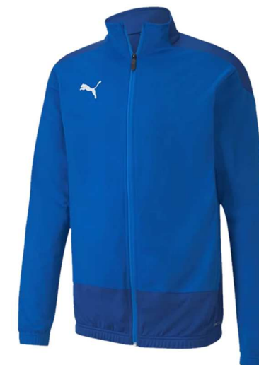
Training Polyesterjacke Blau 656561 - Ele. Blue Lemonade 100% Polyester