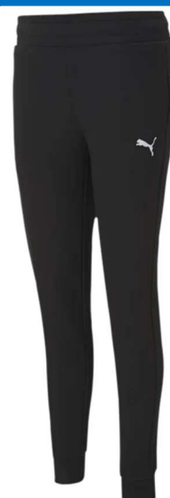
Casuals Trainingshose Damen 657084 - Puma Black 68% Baumwolle, 32% Polyester, Eingriffstaschen