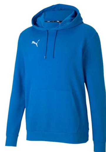
Casuals Hoody Blau 656580 - Ele. Blue Lemonade Kapuzenfutter: 100% Baumwolle (BW), Rippe: 97% BW 3% Elasthan, Obermaterial: 68% BW 32% Polyester