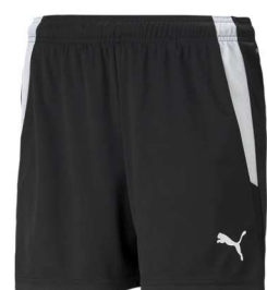
Shorts Damen Schwarz/Weiss 704936 - Puma Black 100% Polyester