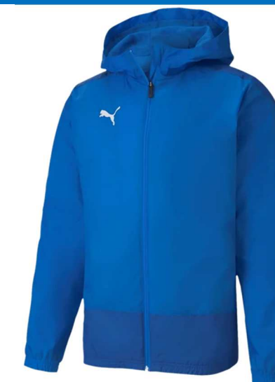
Training Regenjacke Blau 656559 - Ele. Blue Lemonade 100% Nylon