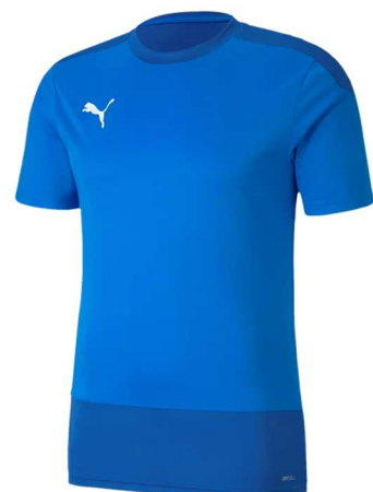
Training Trikot Blau 656482 - Ele. Blue Lemonade 100 % Polyester