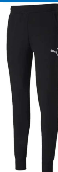
Casuals Pants Jogginghose 656582 - Puma Black 68% Baumwolle, 32% Polyester, Seitentaschen