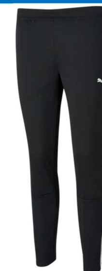
Trainingshose Damen Schwarz 657254 - Puma Black 100 % recycelter Polyester, Reißverschluss tasche