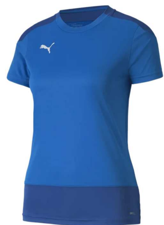
Training Trikot Damen 656940 - Ele. Blue Lemonade 100 % Polyester